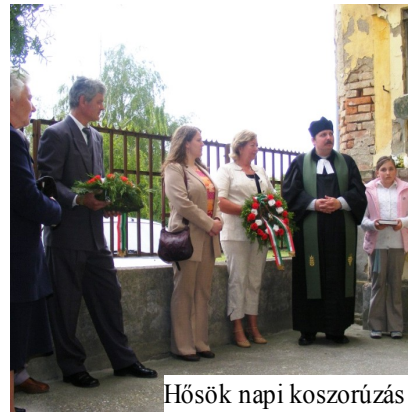
Hősök napi koszorúzás