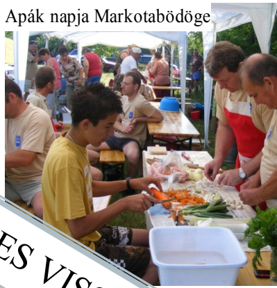
Apák napja Markotabödöge