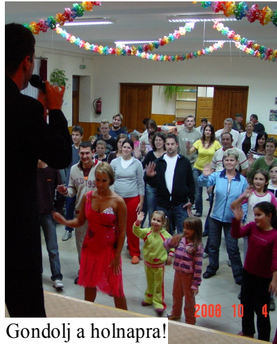
Gondolj a holnapra!