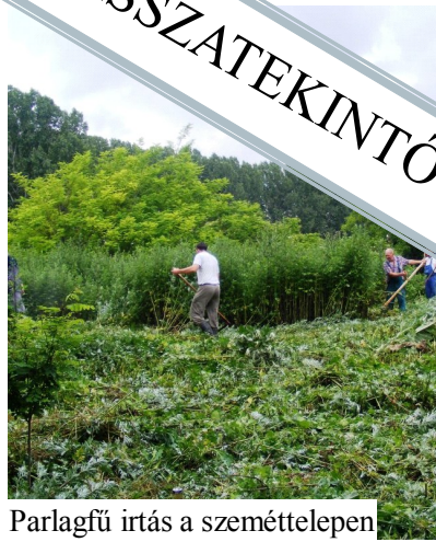
Parlagfű irtás a szeméttelen