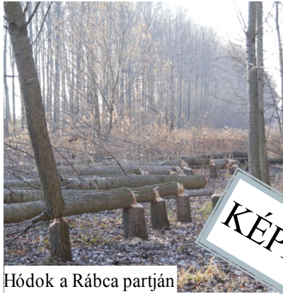
Hódok a Rábca partján