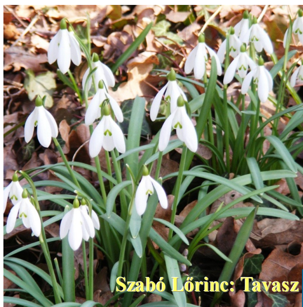
Szabó Lőrinc: Tavasz